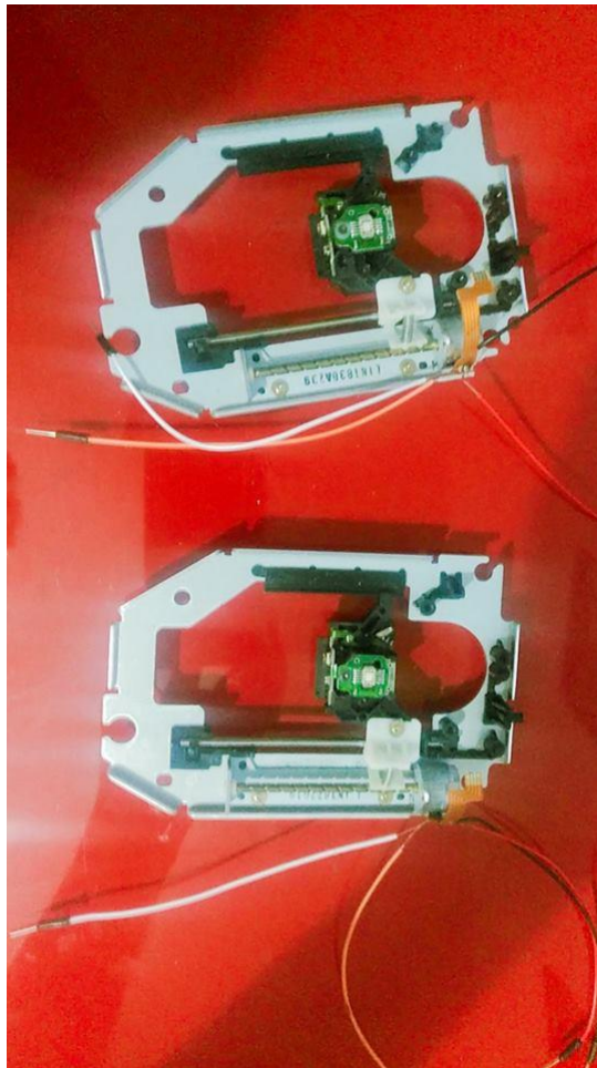
Fig.2 - Motores de Passo com os cabos soldados